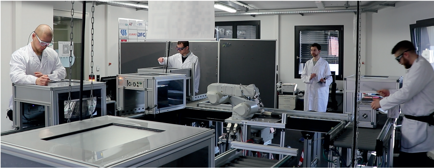
Bild 1: Forschungs- und Anwendungszentrum Industrie 4.0 in Potsdam.

fahrungswissen an Bedeutung verlieren. Für die Beschäftigten können kognitive AS ebenso vorteilhaft sein. Durch die kognitive Unterstützung wird es möglich, ohne längere Einarbeitungszeiten eine breitere Varianz von Tätigkeiten durchzuführen und so einseitige physische Belastungen zu vermeiden [4]. Bei hoher Produktvarianz und somit häufig wechselnden Tätigkeitsabläufen kann der Einsatz kognitiver AS auch zur Reduktion von Stress beitragen (ebd.).