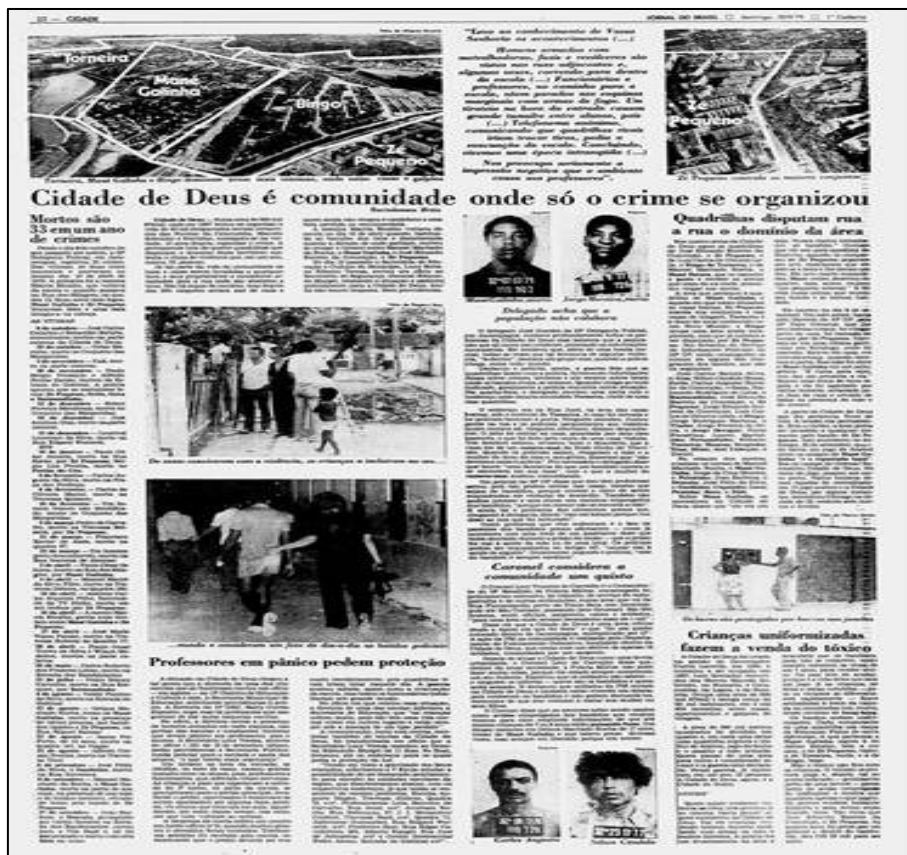
Fonte: Jornal do Brasil , Rio de Janeiro, 30 set. 1979.

Nesse momento as reportagens usam o termo quadrilhas, que são caracterizados pelo domínio de um território específico, nesse contexto da “guerra”. A denominação facção ainda não é vista, pois abrange uma superioridade e organização maior, não apenas na questão territorial. Essa denominação de quadrilhas está ligada mais a questão de gangues locais.