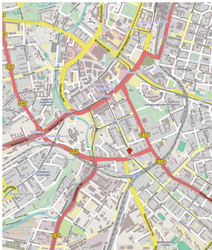
Lage der ExKas in Chemnitz

leer stehenden Gebäudes. Das ehemalige Kaufhaus bot mit einer weiträumigen Eingangshalle, dem breiten Treppenaufgang und vielen Zimmern in den oberen Etagen ein differenziertes Raumprogramm, ließ vielfältige Nutzungen zu. Das Reitbahnviertel als Standort des Hauses erweitert in südlicher Richtung das Stadtzentrum und verbindet es mit dem Campus Süd der Technischen Universität und dem Smart System Campus (s. Karte), der sich mit dem Fraunhofer Institut zum Wissenschaftsstandort auch für Startups wissenschaftsnaher Unternehmen entwickelt. Das uni-affine Projekt des ExKas war in der Wahrnehmung seiner Macher und eines Gutteils seines Publikums als Link zwischen diesen Stadträumen sehr gut platziert. Es avancierte zu einem Anker des städtischen Konzeptes für ein kreatives Quartier unter dem Namen „Experimentelles Karree“. In einem integrierten Planungsverfahren der Kommune setzten sich professionelle Moderator/-innen für die Vereinbarung der Interessen der Eigentümer mit denen der Bewohner/