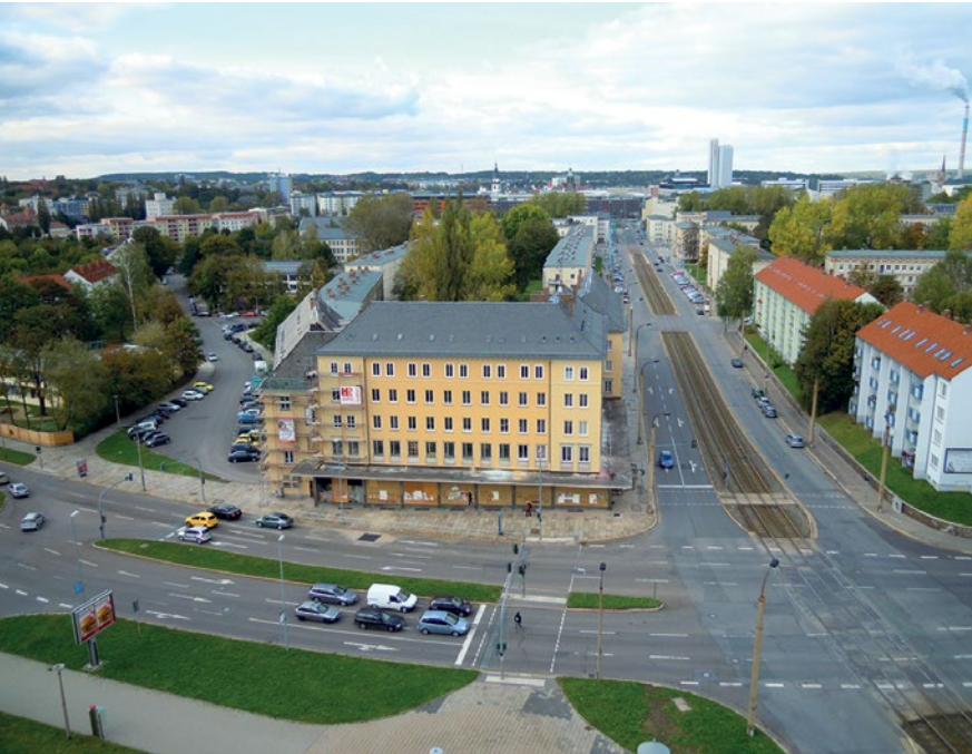
Das Gebäude des ExKas an der Reitbahnstraße in seiner quartierlichen Einbindung