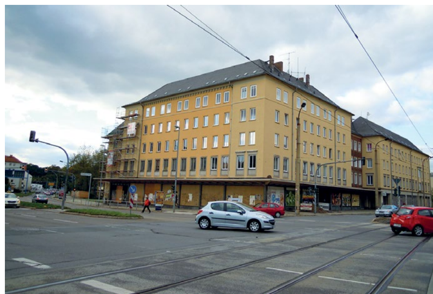
Gebäude des ExKas an der Straßenkreuzung Reitbahnstraße-Ritterstraße im Sommer 2010