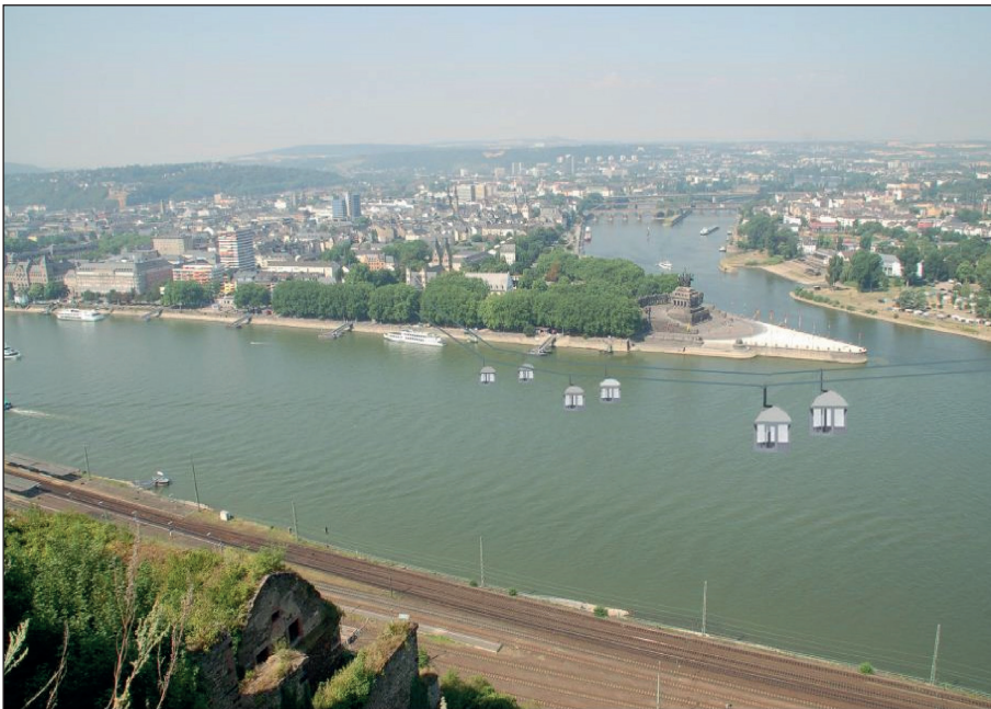
Abb. 1: BUGA 2011 Koblenz – Seilbahn-Simulation mit Talstation

Das rheinland-pfälzische Oberzentrum Koblenz (ca. 110.000 Einwohner) war Gastgeber der Bundesgartenschau (BUGA) 2011. Die topographische Lage von Koblenz an Rhein und Mosel und zwischen den Mittelgebirgen von Westerwald, Hunsrück und Eifel bedingte eine räumliche Verteilung der Kernbereiche der BUGA 2011 links und rechts des Rheins. Die BUGA-Planer entwickelten daher den Vorschlag, beide Bereiche des Ausstellungsgeländes mit einer neu zu errichtenden Kabinen-Seilbahn über den Rhein zu verbinden und dabei auch die Höhendifferenz von rund 110 Metern bestmöglich zu überwinden. Die neue Seilbahn sollte für einen begrenzten Zeitraum von drei Jahren während und nach der BUGA-Durchführung betrieben werden; im Anschluss war zunächst der Rückbau der Seilbahn geplant, um das Landschaftsbild des Oberen Mittelrheintals nicht dauerhaft zu beeinträchtigen (Aufbau- und Probelauf 2010 / Betrieb 2011–2013 / Abbau 2013).