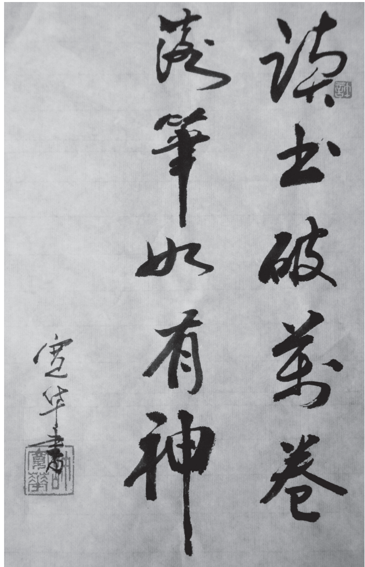
Chinesisch? | Man kann nur gut schreiben, wenn man tausend Bücher gelesen hat.

Gerade in Bezug auf die Gruppe der funktionalen Analphabeten hat es in