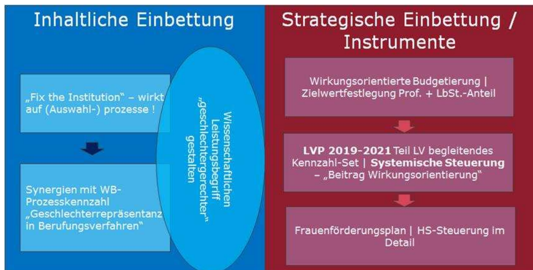
Abbildung 3: Einbettung eines möglichen österreichischen Kaskadensteuerungsmodells