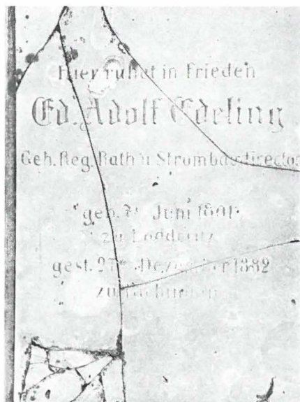
Alte Grabsteinplatte auf dem Friedhof in Niederlahnstein, die vor kurzem durch eine neue mit leider veränderter Inschrift ersetzt worden ist.