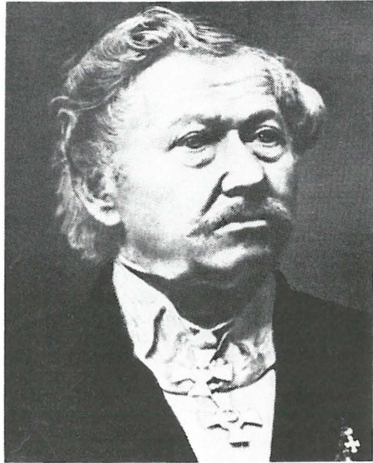
Eduard Nobiling/Edeling (1801 – 1882)

im März 1828 dem Oberbaurat Bauer in Berlin zugestellt wurde, ging bei einer Befahrung der Mosel mit Dampfschiffen von 4½ Fuß Tiefe aus und rechnete mit einem Kostenaufwand von etwa 400 000 Reichstalern. 7 Da aber daraufhin in den nächsten Jahren nichts unternommen wurde, verwies der Trierer Oberbürgermeister Haw 1833 in einer Adresse des Rheinischen Provinziallandtages an den König erneut auf die ungünstige Verkehrssituation im Moseltal und forderte mit der Regulierung der Mosel gleichzeitig eine Verbesserung der Saarschiffahrt.