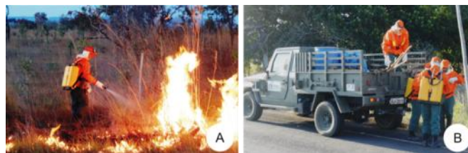
Figura 8A. Equipe de brigadistas do Monumento.

Figura 7A. Brigadista combatendo o fogo. B. Brigadistas se preparando para atuarem nas áreas com foco de incêndio.