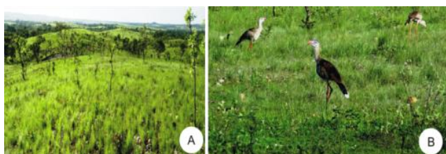
Figura 2A. Paisagem do Monumento com predomínio do Bioma Cerrado. B. Animais silvestres encontrados no Monumento.

Nesse contexto, o presente estudo procurou abordar as ações e as atividades desenvolvidas na UC ao longo de seus 16 anos de existência conforme as especificações do Plano de Manejo (MSR/OIKOS, 2005), além de proporcionar comentários sobre as pesquisas realizadas na referida unidade. Tal síntese tem por objetivo fornecer ao público leigo e especializado as informações adequadas sobre a atual gestão do MNAFTO.