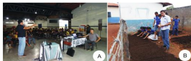
Figura 6A. Atividade realizada no Colégio Estadual de Filadélfia. B. Atividade de Educação Ambiental desenvolvida na Escola Municipal Nossa Senhora do Perpétuo Socorro, no distrito de Bielândia.

As visitas ao Monumento são realizadas por meio de agendamento prévio, via e-mail ou telefone e passam por duas etapas: a primeira é uma explanação de aproximadamente 30 minutos, na sede, a segunda, ocorre no campo, nas fazendas que exibem os melhores afloramentos (Buritirana e Andradina). Os visitantes são guiados pela equipe da UC ou por guia terceirizado, devidamente autorizado pelo órgão gestor da UC. Duas fazendas oferecem alimentação (almoço), havendo necessidade de comunicação antecipada. A outra opção é o próprio comércio do