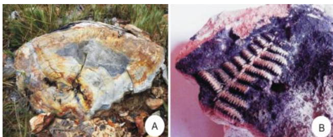
Figura 5A. Caule de samambaia do gênero Tietaea sp. encontrado no campo.

Figura 4A. Fragmento de tronco de gimnosperma com anéis de crescimento. B. Pina de samambaia pertencente à espécie Buritiranopteris costata Tavares et al. (2014).