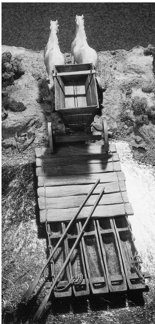
Abb. 4 Modell einer Einbaumfähre im Städtischen Museum in Hameln, rekonstruiert in Zusammenarbeit mit dem Deutschen Schifffahrtsmuseum in Bremerhaven. Abgebildet in: Norbert Humberg u. Joachim Schween (Hg.): Die Weser. Ein Fluß in Europa. Bd. 1. Leuchtendes Mittelalter. Ausstellungskatalog. Holzminde 2000. S. 282.

Da nach dem Verlust des Objekts eine dendrochronologische Datierung nicht mehr möglich ist, Einbäume typologisch kaum datierbar sind und keine Fundvergesellschaftung festgestellt wurde, muß die Frage nach dem Alter des Forster Einbaums offen bleiben.