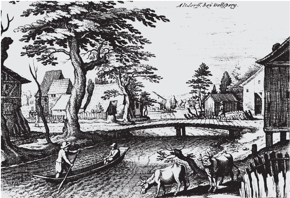
Abb. 1 Einbaum auf der Sorne im schweizerischen Bassecourt 1620/22. Aus Matthäus Merian: »Altdorf, bey Dellsperg« (Bassecourt). 1620/22. Stadtarchiv Straßburg 1266 I, Fol. 31. Abgebildet bei: Lucas Heinrich Wütherich: Das Druckgraphische Werk von Matthaeus Merian d. Ä. Bd. 1: Einzelblätter und Blattfolgen. Basel 1066. Abb. 288 u. S. 130.

Ausgehöhlte Baumstämme spielen heute als Wasserfahrzeuge in Europa praktisch keine Rolle mehr, und in der Regel verbindet man mit Einbäumen heute eine gewisse Übersee-Exotik. Um so überraschender erscheint es, daß Einbäume noch heute zu den Attraktionen des österreichischen Mondsees mitten in Europa gehören, wo sie bis in das 20. Jahrhundert traditionell in der Fischerei genutzt wurden. Tatsächlich sind Einbäume vielfach bis in das 19. Jahrhundert und darüber hinaus nachweisbar, im deutschsprachigen Raum vor allem im Nordosten zwischen Kieler Förde und Oder sowie an den Seen der Alpen. 1