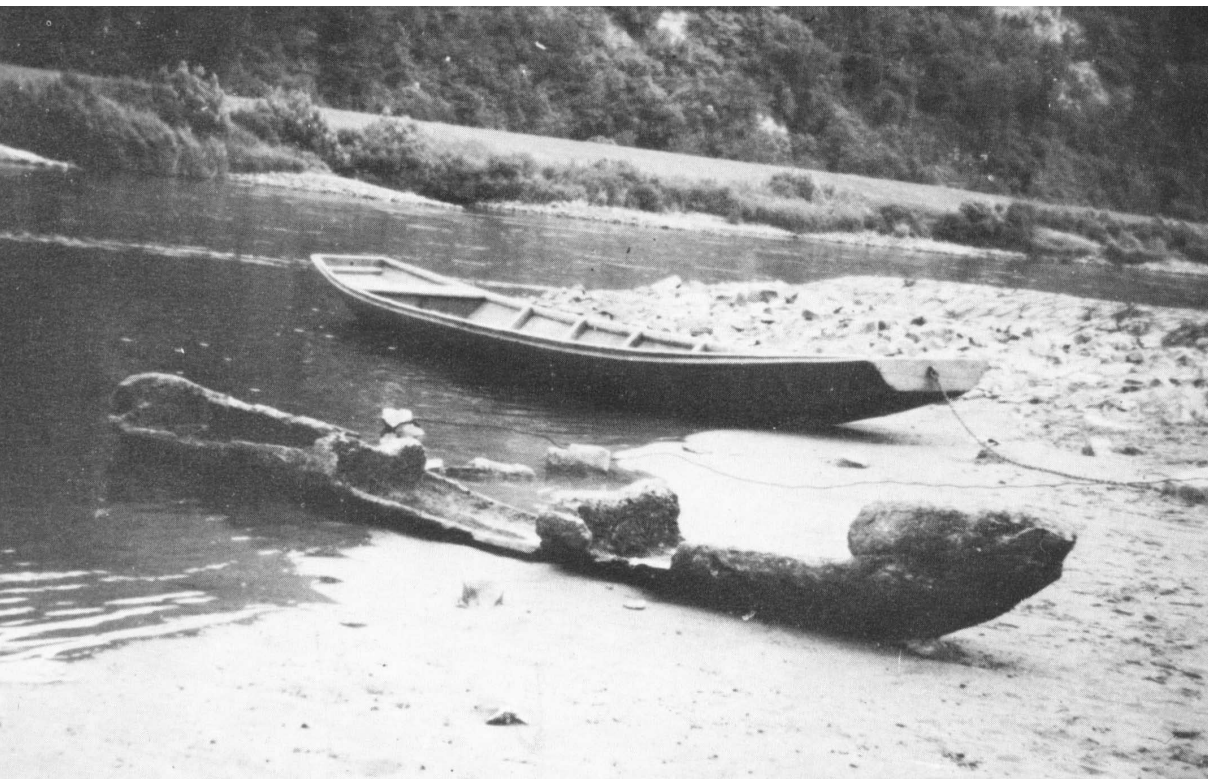
Abb. 2 Foto des Forster Einbaumfunds am Heinsener Weserufer. Im Hintergrund das Lattenschiff des Heinsener Fischers. Foto (Decher) abgebildet bei: Curt Sauer Milch: Einbaum für Braunschweig gesichert. In: Täglicher Anzeiger Holzminden. 6.7.1938.

beim Auslegen seiner Aalreusen mit seinem Lattenschiff 100 m oberhalb des Dampferanlegers von Forst am rechten Weserufer schon vor längerer Zeit auf einen »rätselhaften Gegenstand« am Grund der Weser gestoßen. Am Samstag, dem 2. Juli 1938, hob er hier einen recht gut erhaltenen Einbaum aus etwa 2 m Wassertiefe und transportierte ihn in seinen Heimatort Heinsen auf dem gegenüberliegenden Ufer. 17 Damit hatte der Fund nicht nur die Kreisgrenze zwischen den Kreisen Holzminden und Hameln-Pyrmont, sondern auch die damalige Landesgrenze zwischen Braunschweig und der Preußischen Provinz Hannover überschritten.