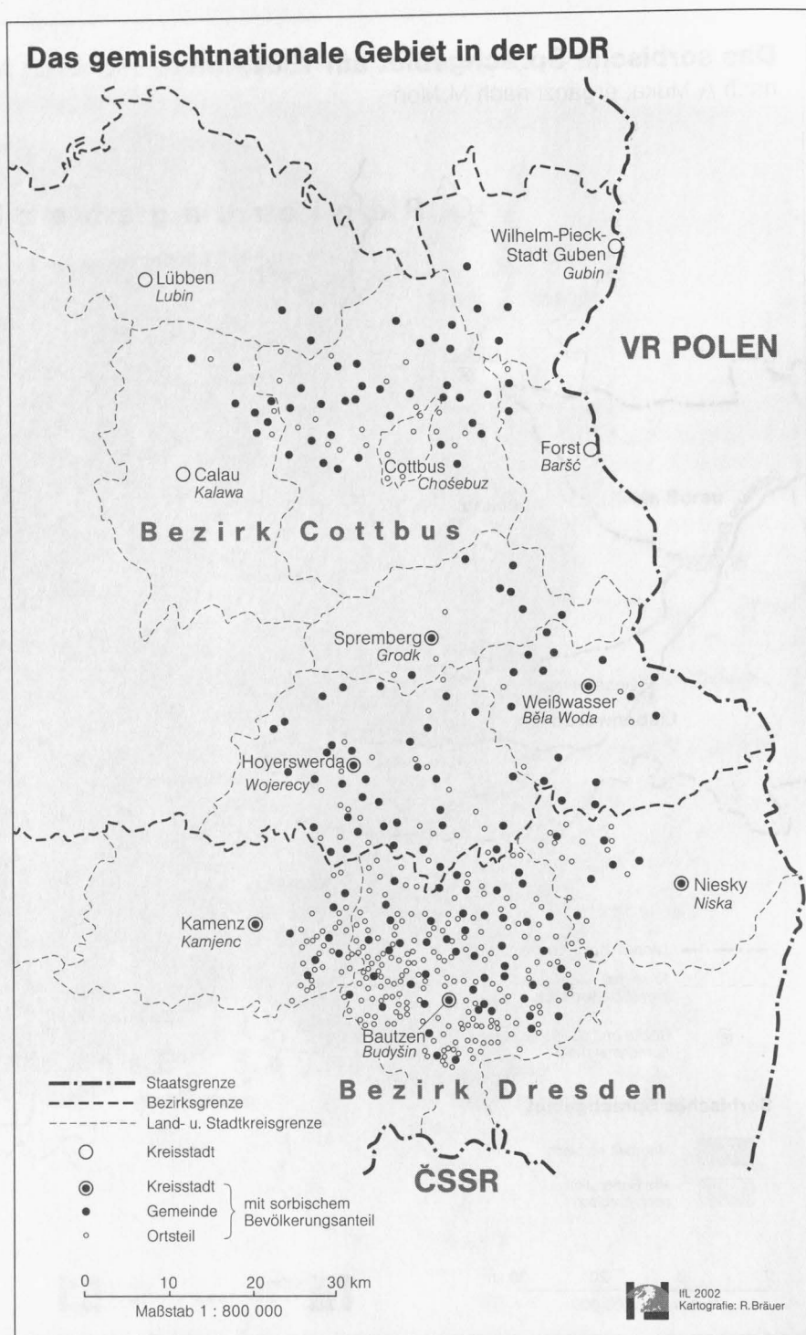
Abb. 3: Das gemischtnationale Gebiet in der DDR/Dwunarodnostne kónčiny

In den 40 Jahren ihres Bestehens hat die DDR sorbische Sprache und Kultur materiell beträchtlich gefördert. Die rechtliche Stellung der Sorben war im internationalen Vergleich zeitweise vorbildhaft. Das Recht auf öffentliche Anwendung der Sprache, darunter vor Gericht, war ebenso gesichert wie die zweisprachige Beschriftung von Ortstafeln, Straßen, staatlichen Einrichtungen und Dokumenten. Ein differenziertes Schulwesen wurde aufgebaut. Die Gründung kultureller