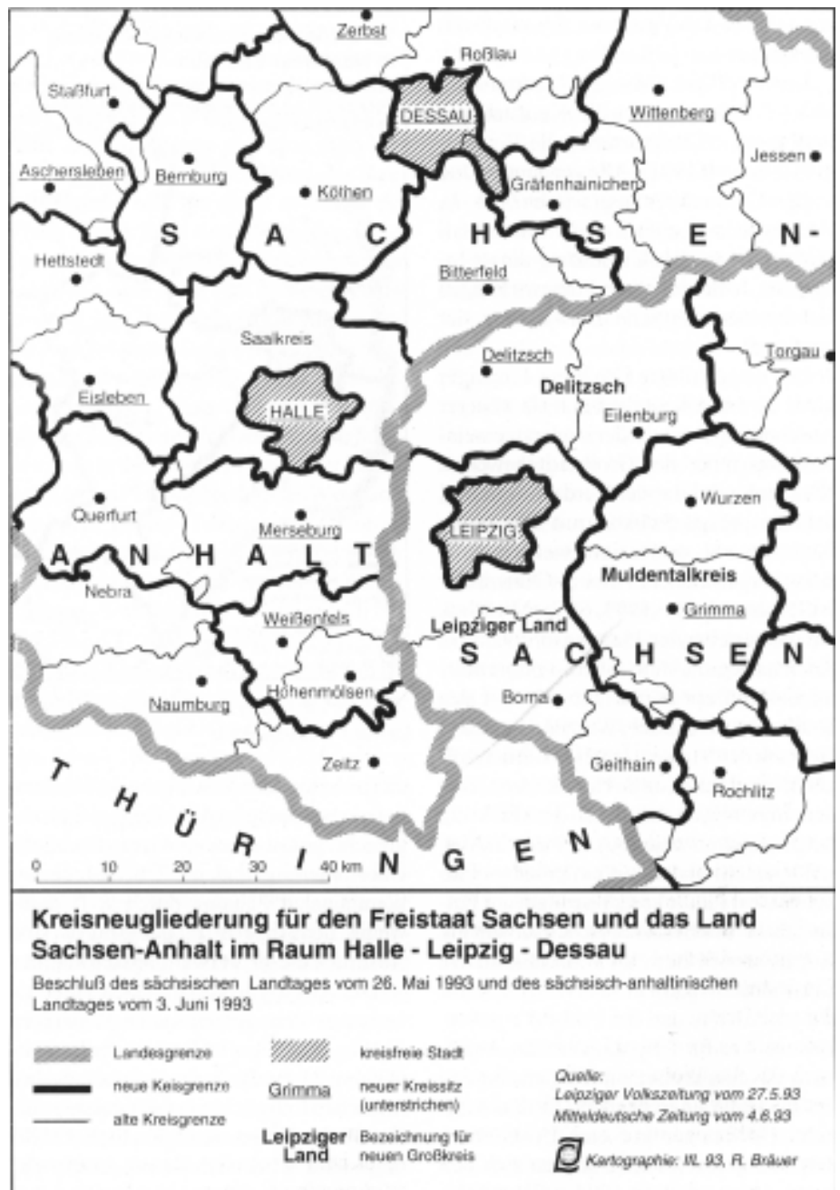
Abb. 3a: Kreisneugliederung im Raum Halle-Leipzig-Dessau

Die Gebietseinteilung beinhaltet ein starkes strukturelles Ungleichgewicht zwischen den dynamischen Gemeinden, die an Leipzig angrenzen und dem vom rückläufigen Braunkohlenbergbau und teilweise stark ländlich geprägten Raum im Süden. In Sachsen-Anhalt wurde der Saalkreis mit rund 60 000 Einwohnern beibehalten, der damit unter dem vorgeschriebenen Mindestsoll (80 000 EW) liegt 4 . Die Kreisreformmodelle der Länder Sachsen und Sachsen-Anhalt stellen für die jewei-