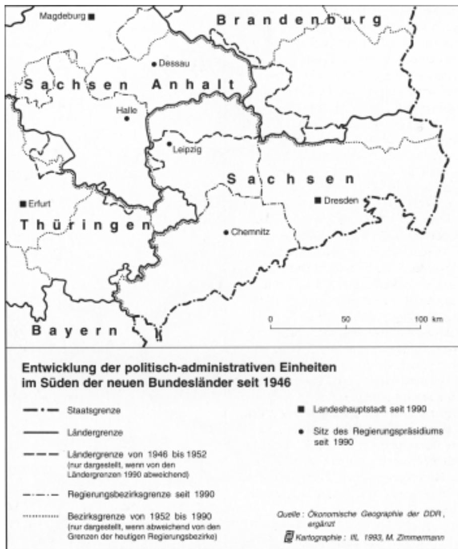
Abb. 2: Entwicklung der politisch-administrativen Einheiten im Süden der neuen Bundesländer seit 1946

Die sich abzeichnende unkoordinierte Besiedlung der Region mit ihren negativen ökologischen Auswirkungen durch Landschaftsverbrauch und erhöhtem Verkehrsaufkommen beruht insbesondere auf dem