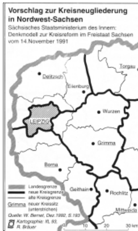
Abb. 3b: Vorschlag zur Kreisneugliederung in Nord-West-Sachsen

Die Leistungsfähigkeit der öffentlichen Verwaltung auf kommunaler Ebene muß als wesentliche Voraussetzung für eine positive wirtschaftliche Entwicklung der Region betrachtet werden. Die derzeitige Verwaltungsgliederung mit der starken Zersplitterung auf Gemeindeebene erscheint dafür allerdings denkbar ungeeignet. Die Einwohnerzahlen der Gemeinden im Umland von Halle und Leipzig liegen überwiegend zwischen 300 bis 1 000 Einwohnern, zwei Drittel der Gemeinden in der Region haben weniger als 1 000 Einwohner. Aufgrund der kleinteiligen Strukturen verfügen die einzelnen Gemeinden nur über geringe Planungskapazitäten, so