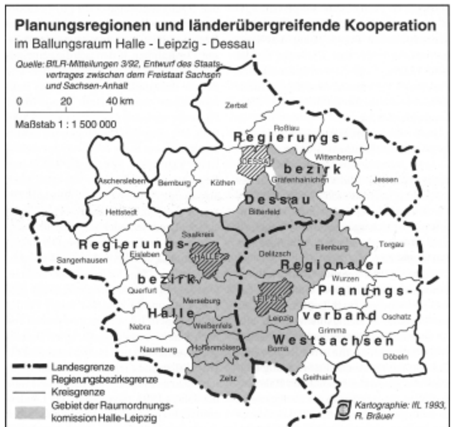
Abb. 4: Planungsregionen und länderübergreifende Kooperation im Ballungsraum Halle-Leipzig-Dessau

Abb. 4 zeigt das Gebiet der benachbarten Planungsregionen und der zukünftigen Raumordnungskommission Halle-Leipzig. Nicht unerwähnt bleiben soll in diesem Zusammenhang die Tatsache, daß mit der grenzüberschreitenden Kooperation an traditionelle Konzepte der gemeinsamen Gebietsentwicklung angeknüpft wird, die in der mitteldeutschen Industrieregion bereits Ende der 20er Jahre existierten.