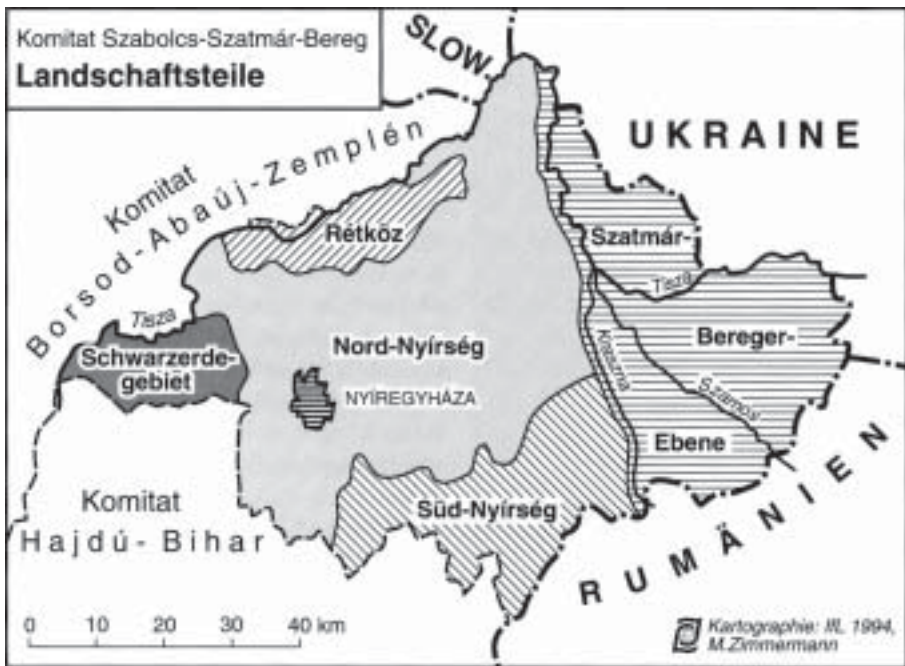
Abb. 4: Landwirtschaftsteile im Komitats Szabolcs-Szatmár-Bereg

stemwechsel hingezogen. Zwischen 1985 und 1990 wurden im Komitat rund 600 Tsd. t Äpfel, 7-10 Tsd. t Sauerkirschen, 20 Tsd. t Pflaumen, 6 Tsd. t Birnen und 3 Tsd. t Pfirsiche jährlich produziert. Allein für den sowjetischen Markt waren es 280-300 Tsd. t Äpfel und große Mengen Obstkonserven jährlich. Leichte Absatzzunahmen zeigte auch der Verkauf auf dem westeuropäischen Markt (v. a. Apfelkonzentrat). Den zunehmenden negativen Folgen des Öffnens der Agrarschere auf die Obstexportwirtschaft Ungarns versuchte man durch gezielte Maßnahmen zu begegnen, wie Anpflanzung von ergebnisreicheren und marktgängigeren Obstsorten, Verkleinerung der Anbaufläche durch ersatzlose Rodung älterer Bestände in den Großbetrieben. Parallel hatte die Obstproduktion in der Hofwirtschaft der LPG'n und in den privaten Hobbygärten so zugenommen, daß die Apfel- und Pflaumenproduktion bis 1990 nicht rückläufig war und die Sauerkirschproduktion bis 1992 noch weiter anstieg.