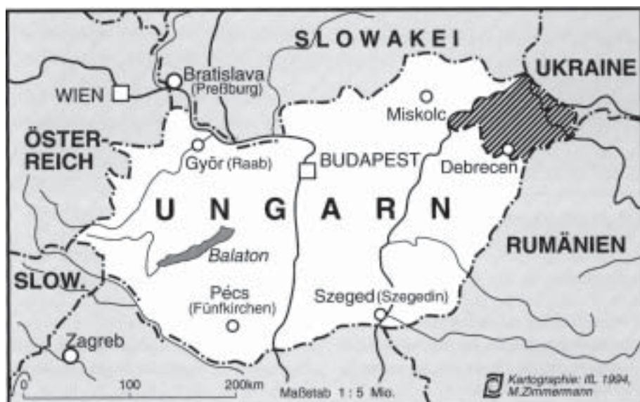
Abb. 3: Die Lage des Komitats Szabolcs-Szatmár-Bereg in Ungarn

In den achtziger Jahren hatte das Komitat einen Anteil von 6 % an der landwirtschaftlichen Produktion Ungarns. Der Anteil einzelner Fruchtarten an der Landesproduktion war dabei allerdings überdurchschnittlich hoch (Äpfel 50-55 %, Tabak 55-60 %, Roggen 40 %, Kartoffeln 12-13 %, Gemüse 7-10 %).