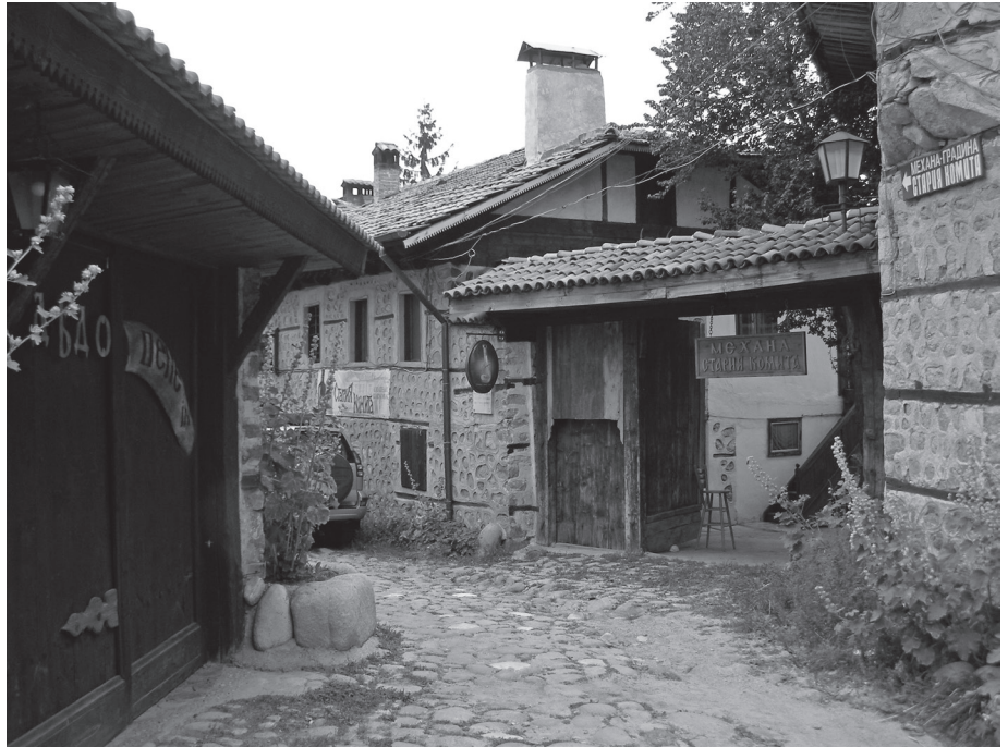
Foto 10: Zeugnisse des baulichen Aufschwungs im 19. Jahrhundert in Bansko

Bilanziert man die Zeit vom 1. bis zum Ende des 2. Bulgarischen Reiches (7.-14. Jahrhundert), dann war es eine Zeit des