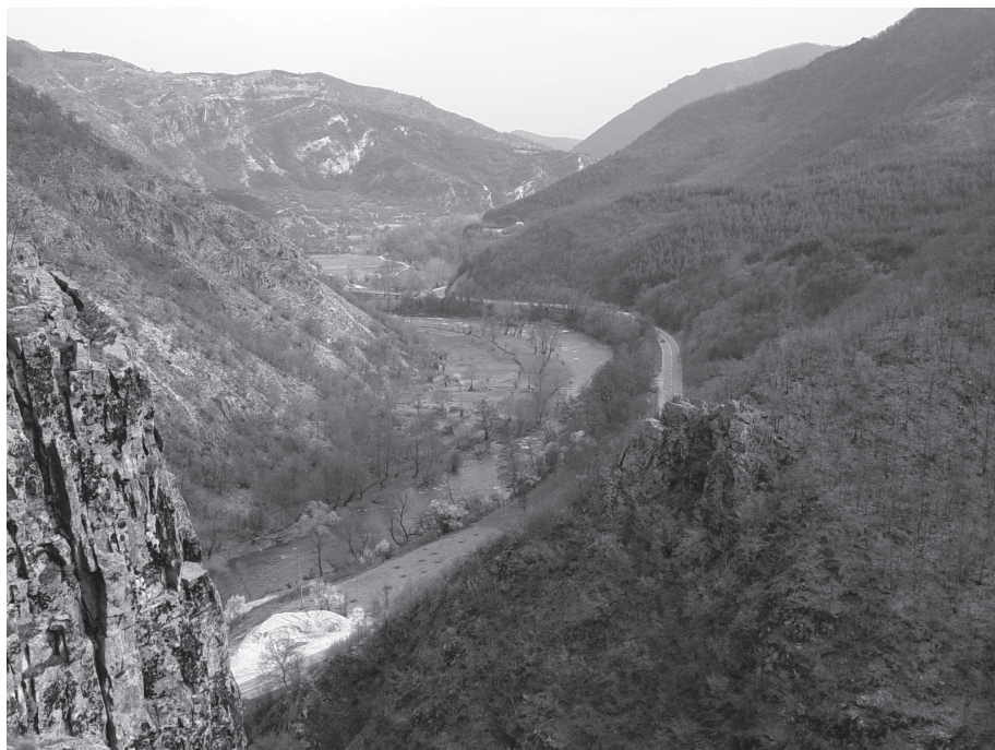
Foto 7: Reste der Festung Momina Kula bei Kremen im Mestatal. Von hier hatte man die Kontrolle über die gesamte Schlucht.