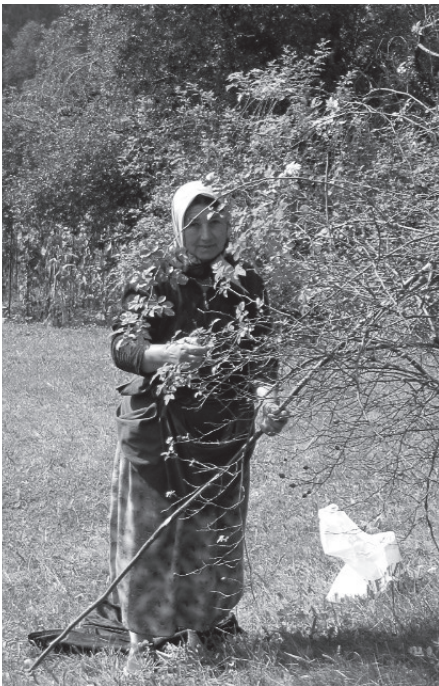
Foto 9: Pomaken in den Rhodopen – archaisch anmutende Lebensweise im 21. Jahrhundert

Eine nomadische Viehwirtschaft in Südosteuropa wurde von den Aromunen betrieben. Insbesondere diese Bevölkerungsgruppe nutzte im Sommer die Hochgebirgsweiden mit ihren Schaf- und Ziegenherden und trieb diese im Winter in die schneefreien Weideplätze in den Ebenen und Küstenregionen (KAHL 1999, S. 1). Seit dem frühen Mittelalter hat sich somit die klimatische Charakteristik der Region im Übergangsbereich vom gemäßigten zum mediterranen Klima erhalten. Die Gebirgsräume konnten im Winter kaum bewohnt und beweidet werden. In den südlichen Becken und Küstenebenen waren milde Winter ohne Schnee typisch. Im Sommer verdorrten die Weiden in den tiefen, südlichen Lagen hingegen, während die feuchteren und kühleren Gebirgsweiden jetzt genutzt wurden (Foto 8). Die Bulgaren