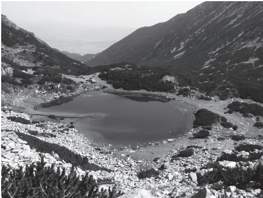
Foto 1: Blick auf den Muratov-Karsee, Moränen und das Bänderica-Trogtal im Nordpirin