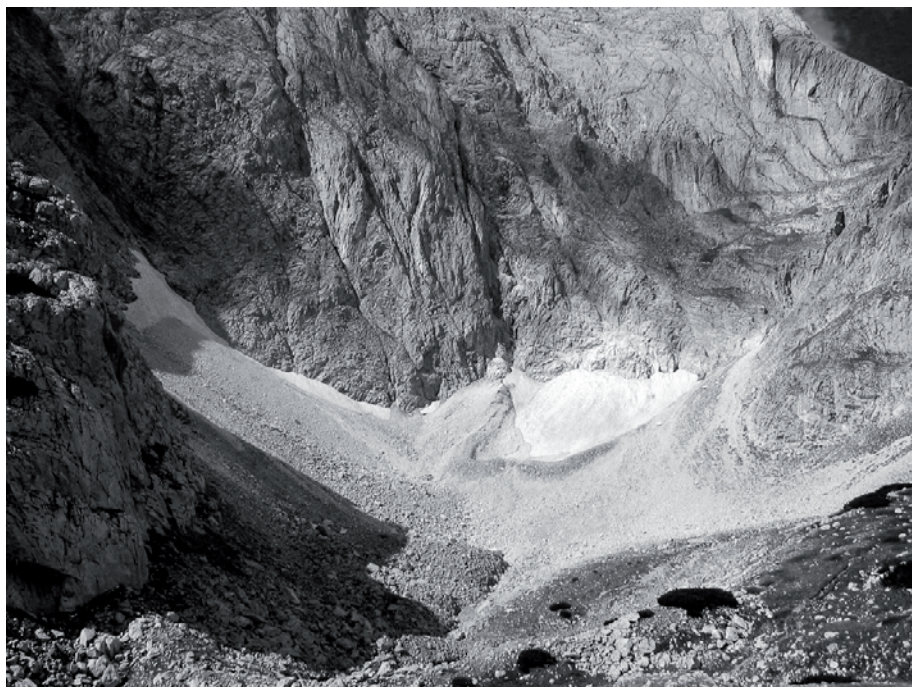
Foto 11: Kar Großer Kessel im Nordpirin – 1850er (?) Endmoränenwall des Vichrengletschers

BLÜMEL (2002, S. 27) gibt den Höhepunkt der ungünstigen Wetterlagen für 1680 bis 1700 an. Es gab jedoch auch einzelne, sehr warme Jahre, mithin eine große Klimavariabilität, die ein großes Produktionsrisiko birgt.