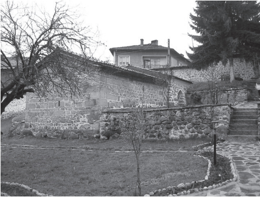
Foto 6: Die Kirche in Dobërsko, wahrscheinlich aus dem 11. Jahrhundert – eine der ältesten erhaltenen Kirchen in SW-Bulgarien