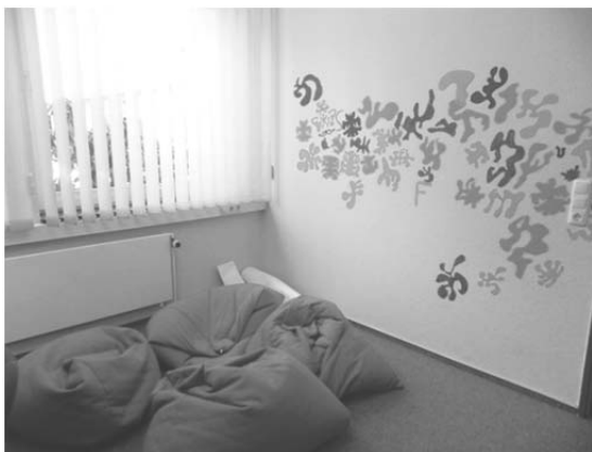
Abbildung 3: Trainingsraum an Schule 4

Andere Schulen gehen diesen Punkt entgegengesetzt an, hier wird Raum gemütlich gestaltet und Getränke bereitgehalten, Anspruch ist es, „dass der Raum schön sein sollte, damit eine Wohlfühlatmosphäre herrscht“ (TrS4). Dies zeigt exemplarisch Abbildung 3, welche aus dem Trainingsraum in der Schule 4 stammt. Auf dem Boden liegen farbige Sitzsäcke, die (als Kontrast zur Möblierung des Trainingsraums in Schule 1), Hinfläzen erlauben, ja geradezu erfordern. Formales, an Arbeitsabläufen orientiertes Sitzen ist auf ihnen nicht möglich. Die Wand ist mit bunten Ornamenten geschmückt, die organisch an Blätter erinnern. Ein Sozialpädagoge erläutert, dass die Gestaltung in Kooperation mit einem lokalen Künstler realisiert wurde. Diese einladende Atmosphäre bietet für sozialpädagogische Arbeit möglicherweise eine günstigere Rahmung, kann aber die Fokussierung auf die Bearbeitung von Unterrichtsstörungen unterlaufen, da es für Schüler*innen eine attraktive Alternative zum Unterricht sein könnte, den Raum aufzusuchen. Es kann vermutet werden, dass es in Einzelfällen zur Vermischung der Aufgaben kommen könnte, wenn die Bearbeitung von Unterrichtsstörungen mit weiteren Beratungsangeboten ausgebaut wird. Hier wäre zugespitzt zu fragen, ob der mit dem Trainingsraum intendierte regelhafte und gleiche Umgang mit Unterrichtsstörungen in einem solchen Setting erreicht werden kann.