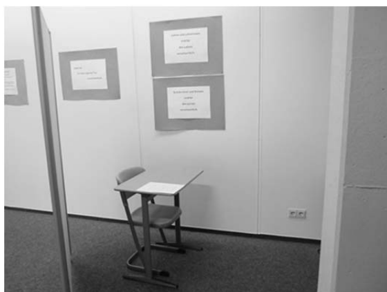
Abbildung 2: Ausschnitt aus dem Trainingsraum in Schule 1

Diese unterschiedlichen Fallstrukturen spiegeln sich in der Raumkonstruktion. In welcher Weise der Raum als pädagogischer Raum durch Artefakte, Design, Einrichtung oder Gestaltung konstruiert wird, ermöglicht Aussagen über die zugrundeliegenden Ordnungen. In jenen beiden Schulen, die den Raum vor allem im Sinne der einheitsorientierten Logik nutzen, wird eine schlichte Einrichtung favorisiert, um den Schüler*innen keine Ablenkung oder Belohnung zu bieten. Hier wird betont, dass es „kein Wohlfühlort“ (TrS2) sein soll. Abbildung 2 zeigt einen Ausschnitt aus dem Trainingsraum in Schule 1, der Raum ist karg eingerichtet, es wird schulisches Mobiliar verwendet, allerdings fehlt die klassenraumübliche Gruppierung mehrerer Tische zu nachbarschaftlichen Arrangements. Es gibt vielmehr Einzeltische, die jede*n Schüler*in an einem Platz isolieren, verstärkt durch mobile Stellwände, die zwischen einzelnen Tischen aufgebaut sind. Kommunikation mit anderen ist schon räumlich nicht vorgesehen, der*die Schüler*in ist auf seine Einzelarbeit verwiesen. Dieser Charakter wird durch die Regeln an der Wand unterstrichen, die den Raum farblich und gestalterisch dominieren und eine permanente Wiederanrufung der Funktion des Trainingsraumes darstellen. Zugespitzt ließe sich hier die Frage stellen, ob dieses Setting eine (schul-)sozialpädagogische Beratung überhaupt noch möglich macht?