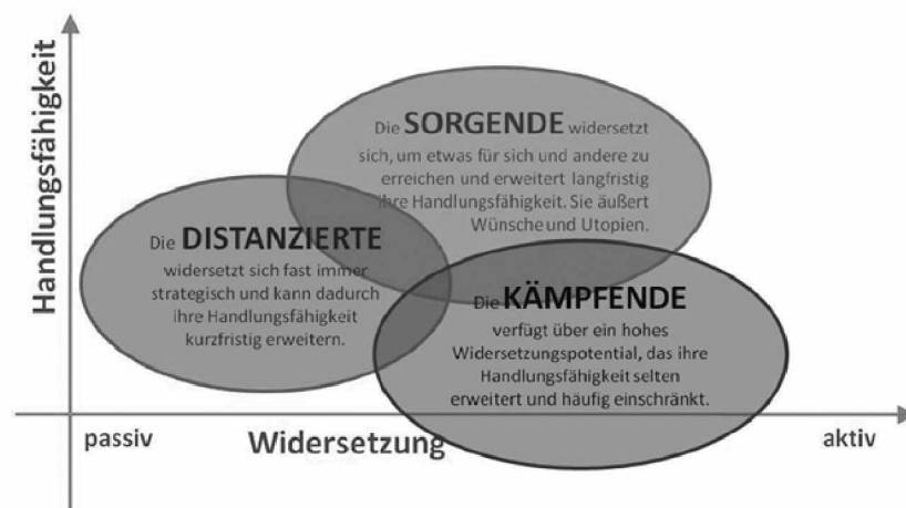
Abbildung 2: Die Korrelation von Handlungsfähigkeit und Widersetzung in drei empirisch begründeten sich widersetzenden Handlungstypen

Es zeigt sich, dass Drogengebrauchende Sexarbeiterinnen handlungsfähig sind. Ihre Handlungsfähigkeit ist jedoch unterschiedlich ausgeprägt, und es ist notwendig, diese Differenzierung in der Diskussion um Empowerment zu beachten. Deutlich wurde, dass die Typen keine monolithisch nebeneinander stehenden Gebilde sind, sondern dass sie miteinander verwoben sind und keine typinterne Kohärenz existiert. Durch die Intersektionale Mehrebenenanalyse des Materials wird sichtbar, dass Drogengebrauchende Sexarbeiterinnen permanent Eigenverantwortung übernehmen (müssen), um zu überleben. Die Möglichkeit wird jedoch stark von der Verfügbarkeit über die eigenen Lebensbedingungen (siehe Winker in diesen Band und Holzkamp 1983: 239) bestimmt und unterscheidet sich damit von Typ zu Typ. Sobald sie jedoch auf Grund gesellschaftlich determinierter Randbedingungen der Anrufung eigenverantwortlich zu handeln nicht nachkommen können, werden sie mit der Zuschreibung, selbst schuld zu sein, konfrontiert (siehe Markard: 2007).