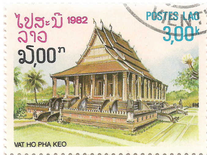
Abb. 1: Ho Pha Kaeo (laotische Briefmarke, 1982) (Copyright: Lao Ministry of Communications, Transport, Post and Construction)

Bereits in jener Zeit stellten sich die Weichen für die unterschiedliche Entwicklung der Königreiche von Lao und Thai. Es war vor allem der bessere Zugang zum Meer, der die siamesische Königsstadt Ayutthaya und später Bangkok prosperieren ließ. Der niederländische Handelsreisende van Wuysthoff berichtete nach seiner Laos-Reise (1641-42) zwar von einem reichen kulturellen Leben am Hofe Vientianes, bemerkte aber gleichzeitig das unzureichende wirtschaftliche Po-