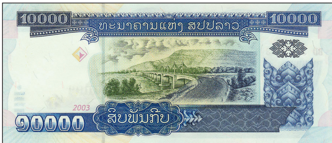
Abb. 4: Mekong-Brücke (10.000-Kip-Banknote, Rückseite, 2002).

nam um die Spitzenplätze. 26 Gemeinsam mit China hat Thailand den viel diskutierten Highway No. 3 durch den laotischen Nordwesten bauen lassen. Von Thailand nach Vietnam ist ebenfalls ein Schnellweg durch Laos errichtet worden. Die Asian Development Bank strebt mit ihrer Förderung von Infrastruktur- und Staudammprojekten die weitere Entwicklung des Wirtschaftsraums „Greater Mekong Subregion“ an (vgl. Thant, 2002). Brückenprojekte am Mekong sind auffällige Ikonen der regionalen Integration und werden von Vientiane und Bangkok gleichermaßen als ökonomische