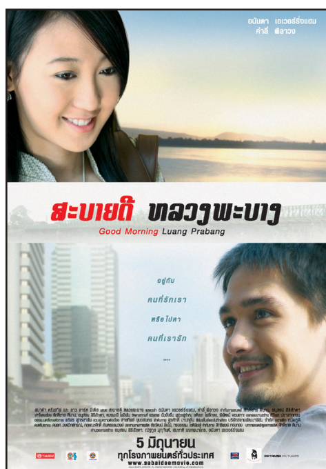
Abb. 5: Filmplakat Sabaidee Luang Prabang

ist, trüben unterschwellige Ressentiments und Vorurteile die Lao-Thai-Beziehung. In thailändischen Filmen und Seifenopern werden die Lao gerne als „Dorfdeppen“ dargestellt, als „unzivilisierter“ als die Thai. 31 Für einen Eklat sorgte auch die beiderseits des Mekong populäre laotische Sängerin und Schauspielerin Alexandra Bounxouai, als sie in einem umstrittenen Interview ihre Geburt auf der „falschen“ Seite des Mekong bedauerte (Rehbein, 2007, S. 120) und als Darstellerin in einer thailändischen Seifenoper – Thai TV wird mittlerweile in ganz Laos empfangen – die laotische Nationalblume Dok Champa in eine Mülltonne warf. Ebenfalls für Proteste und diplomatische Intervention sorgte der Film „Lucky Losers“, der zur Fußball-Weltmeisterschaft 2006 in die Kinos kam. Er sollte ursprünglich von einem thailändischen Trainer handeln, der das eher unterdurchschnittlich veranlagte laotische Nationalteam zur WM nach Deutschland führt – indem er es unter anderem zur Akklimatisierung in einen Kühlwagen sperrt und die Haare blond färbt. Die alberne Handlung wurde von der laotischen Regierung als Verunglimpfung betrachtet. Interessanterweise war der thailändischen Regierung, die bereits den Film über Thao Suranari verhinderte,