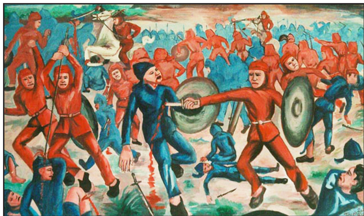
Abb. 3: Ölgemälde im Provinzmuseum von Champasak (Pakse)

Mayoury und Pheuiphahn, dass das Aufbegehren Chao Anuvongs schlecht vorbereitet, chaotisch und selbstmörderisch war – also alles andere als ein ruhmreiches historisches Kapitel. Nimmt man jedoch, so wie es die LRVP-Geschichtsbetrachtung tut, Elemente wie