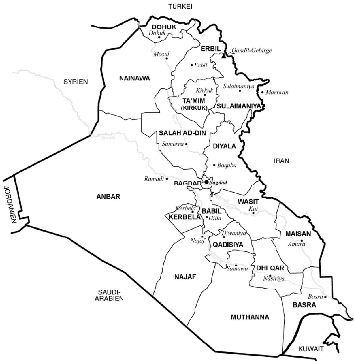
Irak: Provinzen und Provinzhauptstädte

vasion von 2003 bot, und trieben die Konsolidierung des politischen Systems in Irakisch-Kurdistan voran. Die irakisch-kurdische Politik wird bis heute von den beiden Einheitsparteien KDP und PUK dominiert. Sie räumten ihre Zwistigkeiten nach 1998 schrittweise aus und bilden heute ein faktisches Macht-Duopol. Die KDP wird dabei von dem Präsidenten der Kurdenregion, Masud Barzani, und seiner Familie angeführt, die PUK vom irakischen Präsidenten Jalal Talabani. Beide Parteien herrschen durchaus autoritär über die