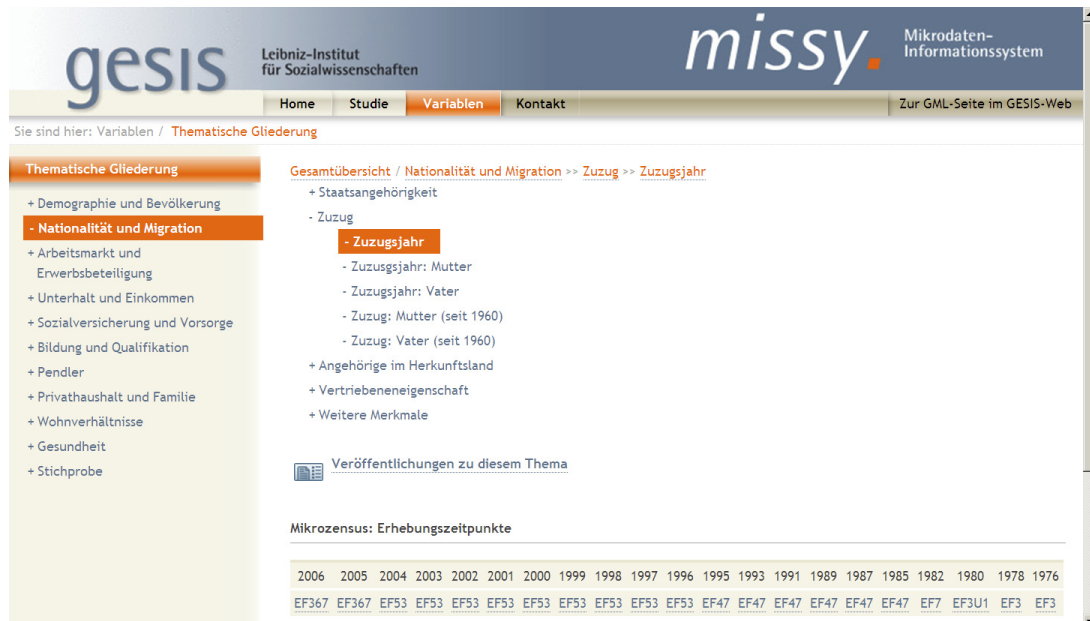
Abbildung 8: Nutzerzugang Thematische Gliederung

Da die Variablennamen und Erhebungsjahre als kontrollierte Vokabulare erfasst sind, können sie aufgrund ihrer eindeutigen Kennung in der Metadatenbank verwendet werden, um Hyperlinks innerhalb der Informationsfelder zu generieren. In Abbildung 9 wird dieses Feature am Beispiel der Verlinkung einer Filtervariable aufgezeigt.