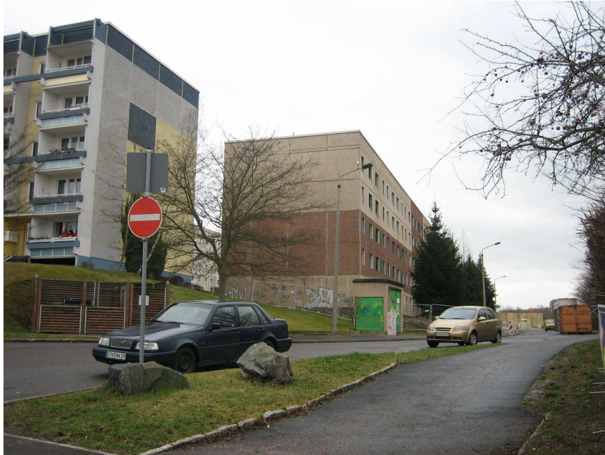
Abbildung 1: rechtes Gebäude (Juri-Gagarin-Straße) vor dem Abriss

Dabei kommt den ostdeutschen Großsiedlungen eine besondere Bedeutung zu. Sie sind nicht länger – wie vor der Wende – begehrte Wohnbereiche, sondern unterliegen einem Abwertungsprozess auf der Grundlage marktwirtschaftlicher Bedingungen, des Wertewandels und der Pluralisierung von Lebensstilen.