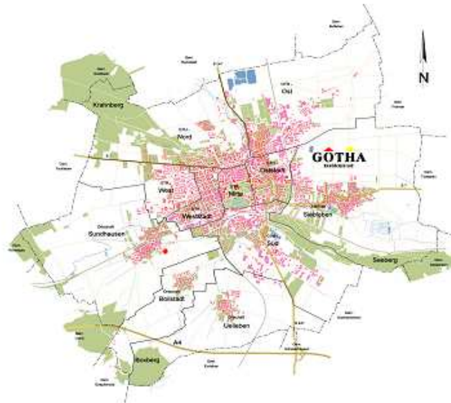
Abbildung 2: Stadtplan Gotha

Die kreisangehörige Stadt Gotha – im 12. Jahrhundert gegründet – ist nach dem Landesentwicklungsprogramm mit derzeit rund 45.000 Einwohnern ein Mittelzentrum mit Teilfunktionen eines Oberzentrums. Der Verflechtungsbereich besteht aus dem Landkreis Gotha und den Unterzentren Ohrdruf und Waltershausen.