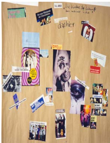
Abbildung 3: Collage der Idealisten aus dem Liberal-intellektuellen Milieu

Die unterschiedlichen Positionierungen zur Kirche werden deutlich im Vergleich zu einer Collage, die Studentinnen aus den Milieus der praktischen Intelligenz angefertigt haben. Ihnen ist die praktische Toleranz im konkreten alltäglichen Zusammenleben zwischen Menschen verschiedener Generationen, Kulturen und Geschlechtern ein zentrales Anliegen. Statt spöttisch-distinktiver Symbolik werden Wünsche nach Emotionalität und Sinnlichkeit besonders betont (Abb. 4).