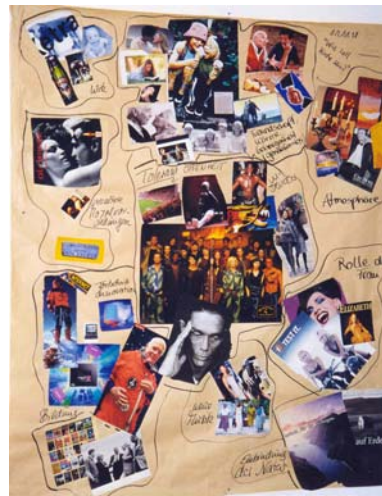
Abbildung 4: Collage von jungen Frauen aus der gesellschaftlichen Mitte