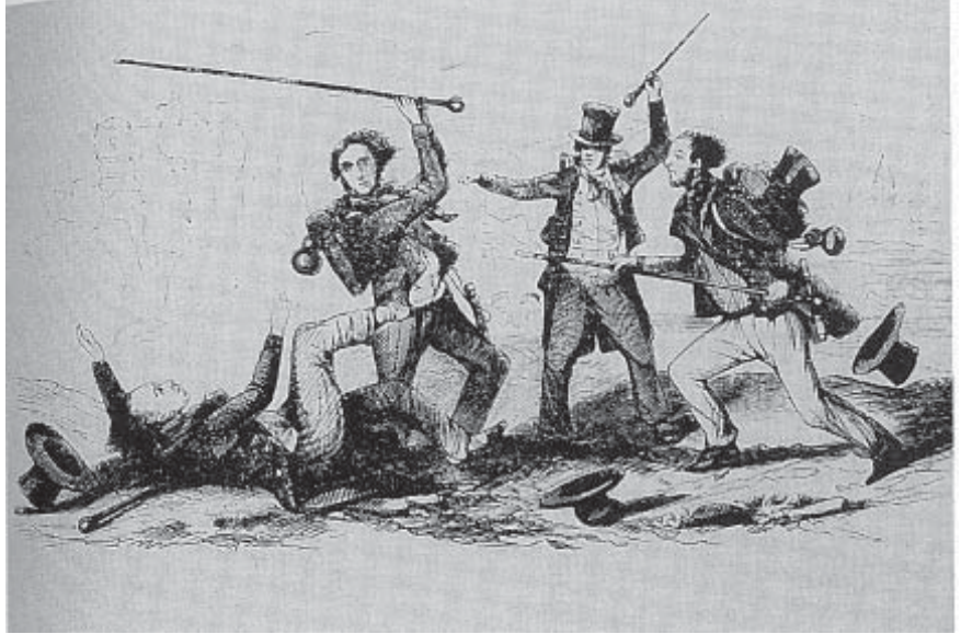
Prügelnde Handwerksburschen – Lithographie aus dem Anfang des 19. Jahrhunderts

Aufgrund der Untersuchungen des Schweizer Soziologen Manuel Eisner, der u. a. mehrere hundert vor allem auf Gerichtsakten basierende historische Fallstudien ausgewertet hat, können wir davon ausgehen, dass zu Beginn der Neuzeit (15. Jahrhundert) die Homizidraten in europäischen Kernländern im Durchschnitt bei einer Rate von etwa 30 pro 100 000 Einwohnern lagen (freilich mit erheblichen Variationen und einzelnen Spitzenwerten weit über 100). Bis 1960 war diese Rate auf etwa 1 pro 100 000 gefallen (in einigen Ländern auf ca. 0,5), um sich anschließend bis Anfang der 1990er Jahre etwa zu verdoppeln.