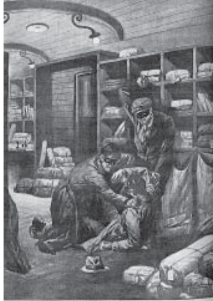
Überfall maskierter Posträuber bei Breslau 1930 – Zeichnung v. A. Lombardi

Wie aber soll die Hypothese, die Erosion kollektivistischer Orientierungen bzw. der parallele Prozess einer Zunahme der Individualisierung mindere die Gewaltneigung, mit dem Befund vereinbar sein, dass in der zweiten Hälfte des 20. Jahrhunderts sowohl die Individualisierung als auch (und möglicherweise gerade deshalb) die Gewalt-