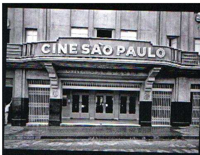
FIGURA 1 – Cine São Paulo, s/d 4

A fotografia do Cine São Paulo revela os detalhes até então despercebidos para nós. Os olhos seguem suas diagonais, convergindo para a inscrição, perfeitamente centralizada, que nos diz tratar-se de um cinema que já não existe mais, pois em seu lugar (na Rua São Sebastião) hoje há uma casa de Bingo. Conduzidos pelas linhas e superfícies,