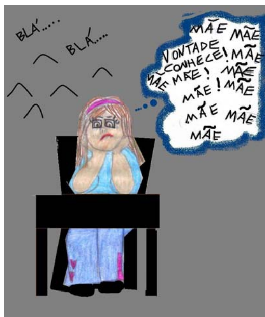
Figura 4: Ilustração do capítulo II do livro (Desejo de ter mãe)

“- Podem sair! Disse Letícia para os seguranças. Marisa!!! você é mesmo a minha filha??! Letícia emocionada abraça a filha”.