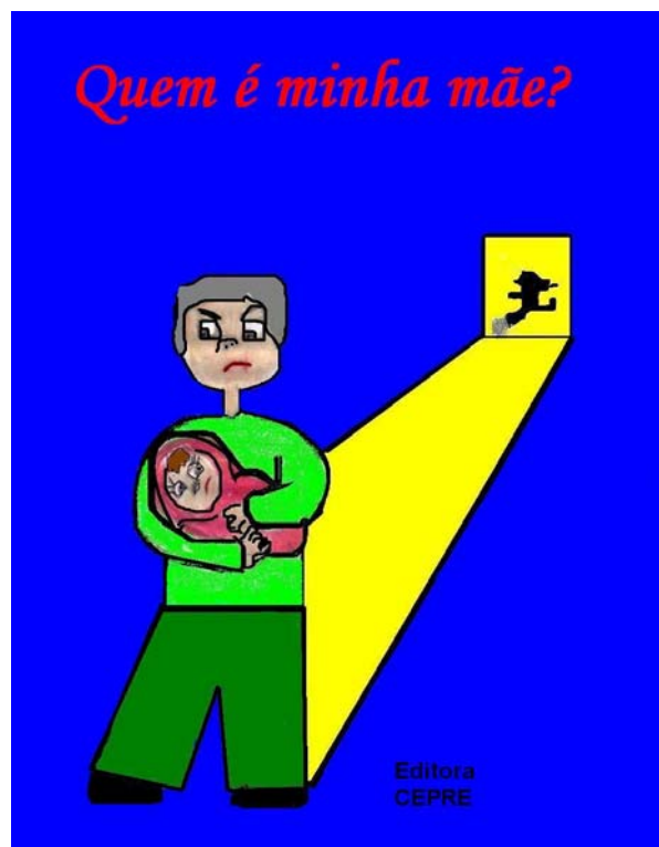
Figura 1: Ilustração da capa do livro, feita por um dos alunos do grupo.

Resolvida a questão inicial (sobre o que escrever), passou-se a discutir, em conjunto, com a instrutora surda e a pedagoga ouvinte, sobre o tema escolhido e o desenrolar da história. Como as discussões eram feitas em sala de aula, foi priorizado para esses momentos a sondagem das idéias que comporiam os diferentes capítulos do livro o que foi realizado por meio da LIBRAS e com a mediação constante da professora surda. O passo seguinte foi iniciar a produção de um texto a partir do qual o grupo pudesse avaliar como seria o início da história e, para isso, uma das alunas trouxe um texto inicial que se transformou em mote para a produção conjunta do livro cujo título seria mais tarde: “Quem é minha mãe?”.